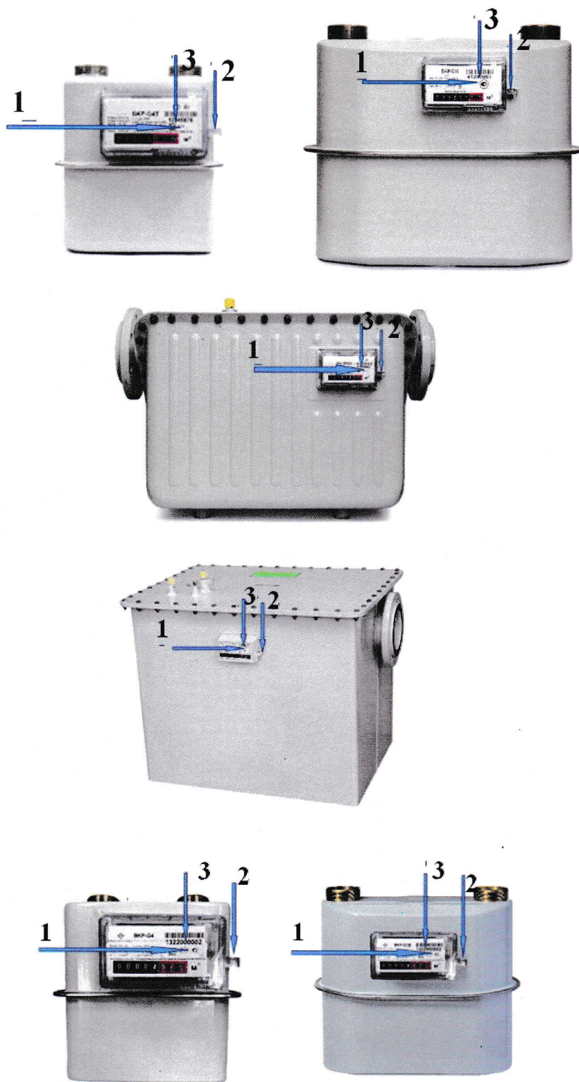
Рисунок 2– Схема пломбировки от несанкционированного доступа, обозначения мест нанесения: 1 - знака утверждения типа, 2- знака поверки, 3-заводского номера